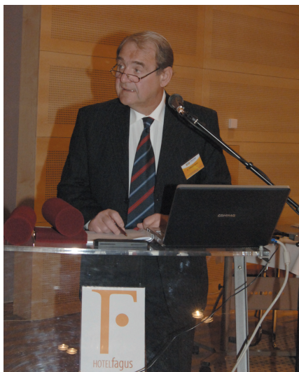
Ferenczi Sándor főorvos úr, a kongresszus elnöke