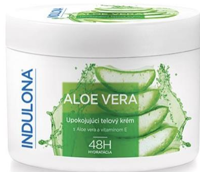
Testápoló krém 250 ml, 1790.- Ft