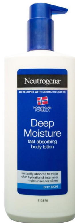
Hidratáló testápoló 400 ml, 2399.- Ft