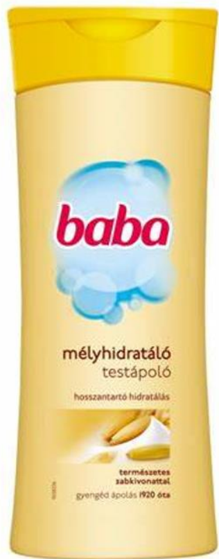
Testápoló tej 400 ml, 1699.- Ft