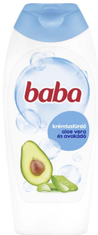
Krémtusfürdő 400 ml, 1399.- Ft