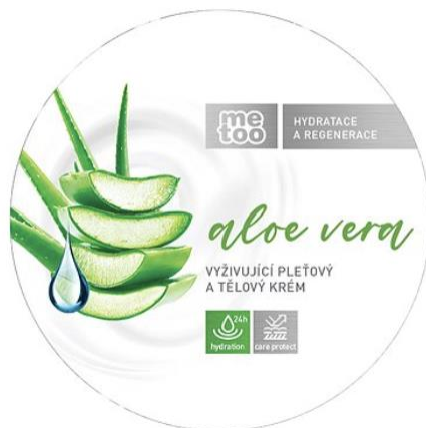
Arc- és testápoló krém 200 ml, 1110.- Ft