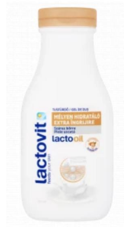
Mélyen hidratáló tusfürdő 300 ml, 899.- Ft